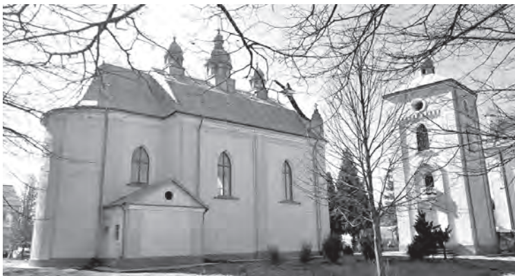
Греко-католицька церква у костелі 1901 року будівництва