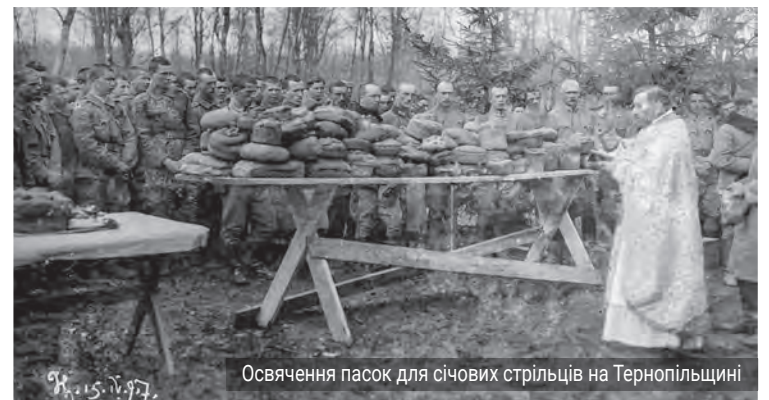
Освячення пасок для січових стрільців на Тернопільщині