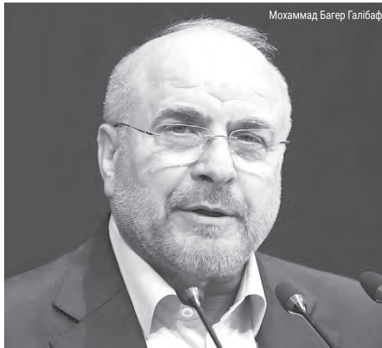
Мохаммад Багер Галібаф

Для Кремля іранська кампанія США стала стратегічною перевагою, оскільки вона відвернула увагу й ресурси Вашингтона від України. Сполучені Штати витрачали боеприпаси, призначені для Збройних сил України, а розбіжності всередині НАТО поглибилися. У Кремлі вважають, що затяжний конфлікт з Іраном підірве позиції Дональда Трампа й Республіканської партії на майбутніх виборах, що, з погляду Путіна, робить будь-які поступки щодо України безглуздими.