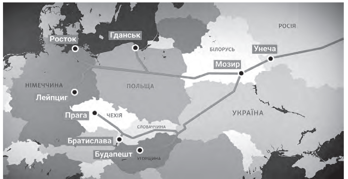
Трубопровід «Дружба» та географія постачання через нього нафти