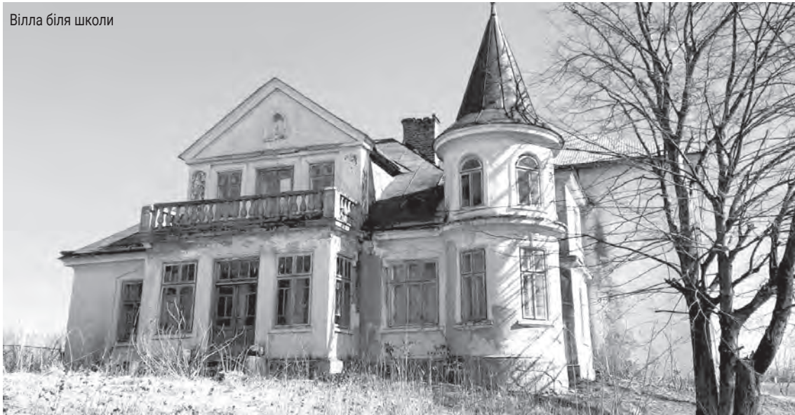
Вілла біля школи