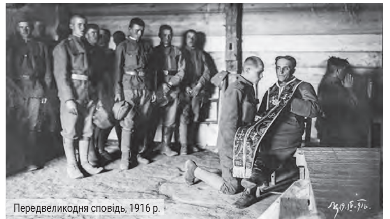
Передвеликодня сповідь, 1916 р.