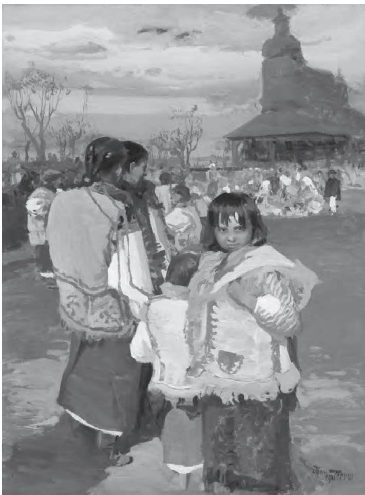
Іван Труш, «Гагілки», 1921 р.