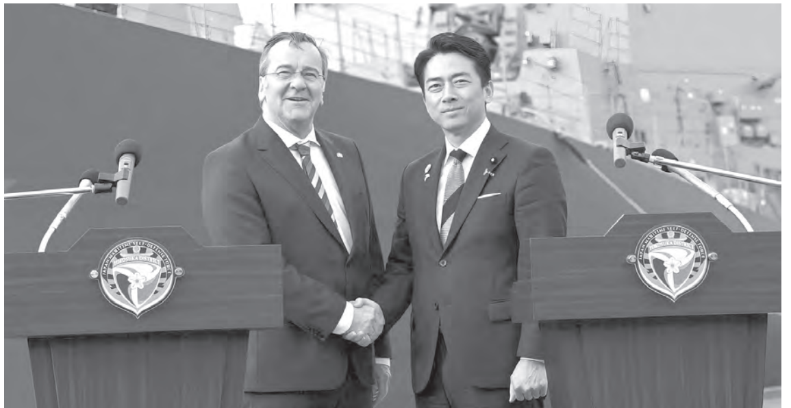
Борис Пісторіус і Сіндзіро Коїдзумі зустрілися на японській військово-морській базі в Йокосуці

Відтак Politico констатувала: «Ця ініціатива відображає ширший стратегіч-